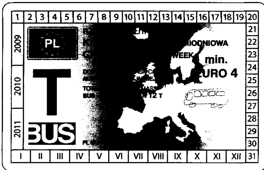
winieta — awers